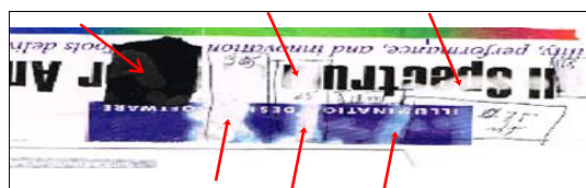
Figura 2: Teste de aplicação de laser infravermelho